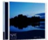
Collection NAT volume 1 | Lakeside