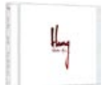
Hang Relaxation Music